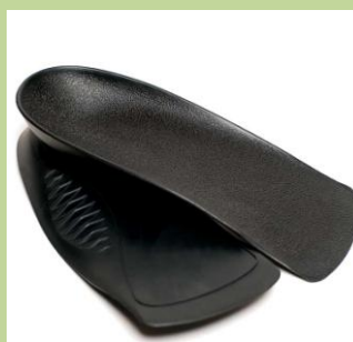
WOMEN'S 3/4 * velikosti B-E pro obuv s podp. do 2,5 cm