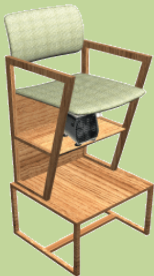
Speciální křeslo Superfeet pro BioVac® systém

Nabízíme pro tuto unikátní BioVac® technologii zhotovení ortopedických vložek originální technologické vybavení vyvinuté firmou Superfeet pro ty lékařské ordinace, které nemají k dispozici tato zařízení (viz obrázky). Protetické laboratoře mohou však využít své obvyklé zařízení. Všechny vložky z programu Custom - Fit jsou k dispozici ve velikostech B - F. Pro podrobnější informace o typech a prezentace těchto ortopedických vložek Custom - fit nás kontaktujte na info@proteching.cz .