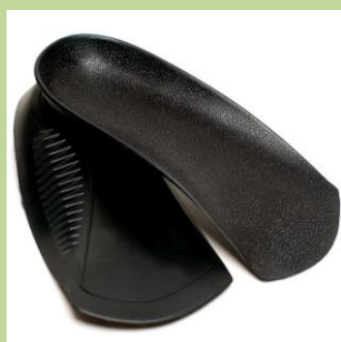
MEN'S 3/4 * Velikosti C-F