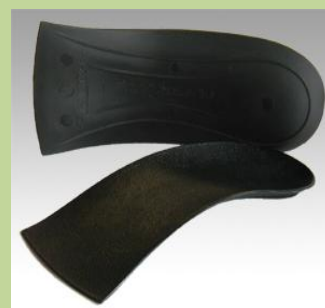
WOMEN'S 3/4 HIGH HEEL * velikosti A - E pro obuv s podp. nad 2,5 cm