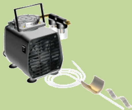
Vakuová pumpa BioVac® systém